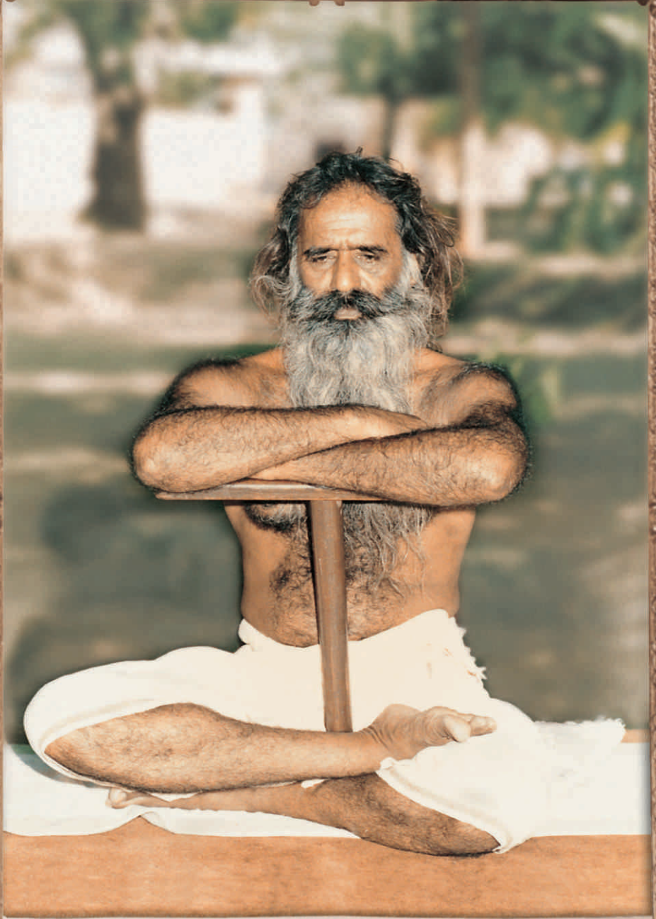
শ্রী স্বামী অড়গড়ানন্দজী (পরমহংস মহারাজের কৃপাধসাদ)